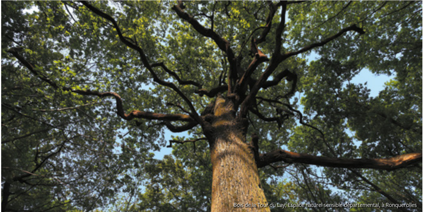
Bois de la Tour du Lay, Espace naturel sensible départemental, à Ronquerolles

L'info dédiée à ceux qui font grandir le Val d'Oise