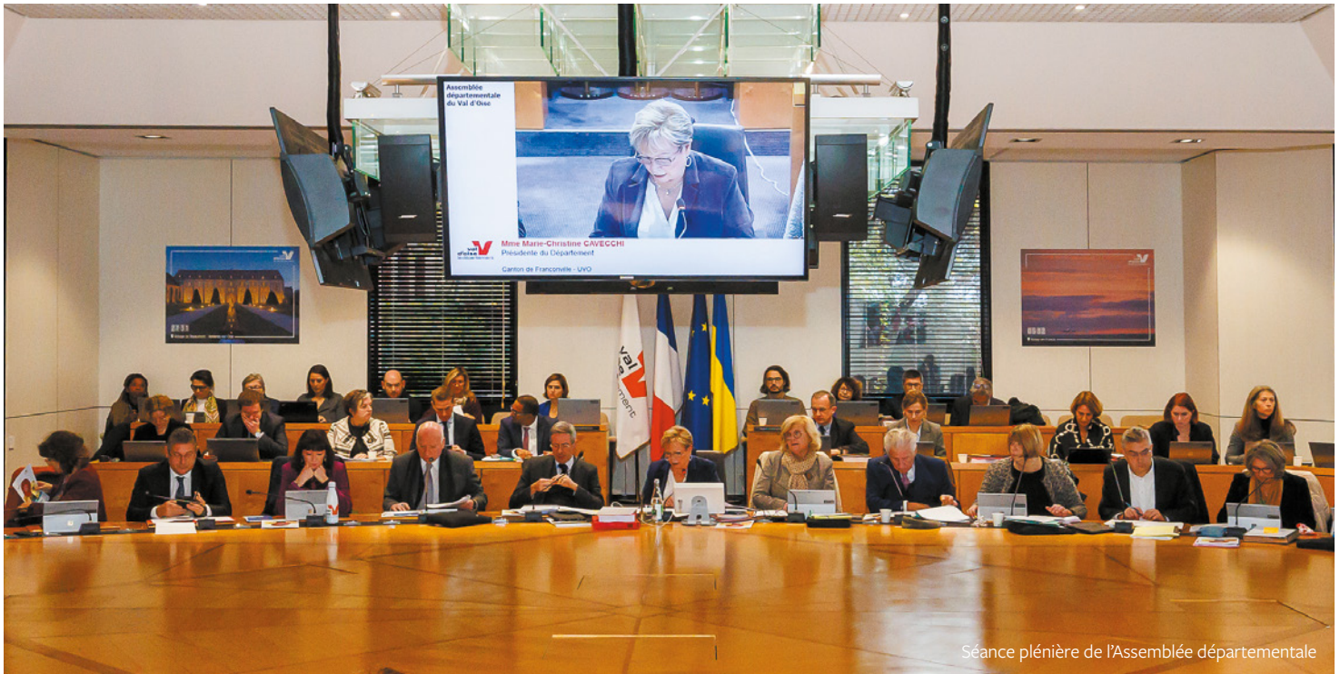
Séance plénière de l'Assemblée départementale

L'info dédiée à ceux qui font grandir le Val d'Oise