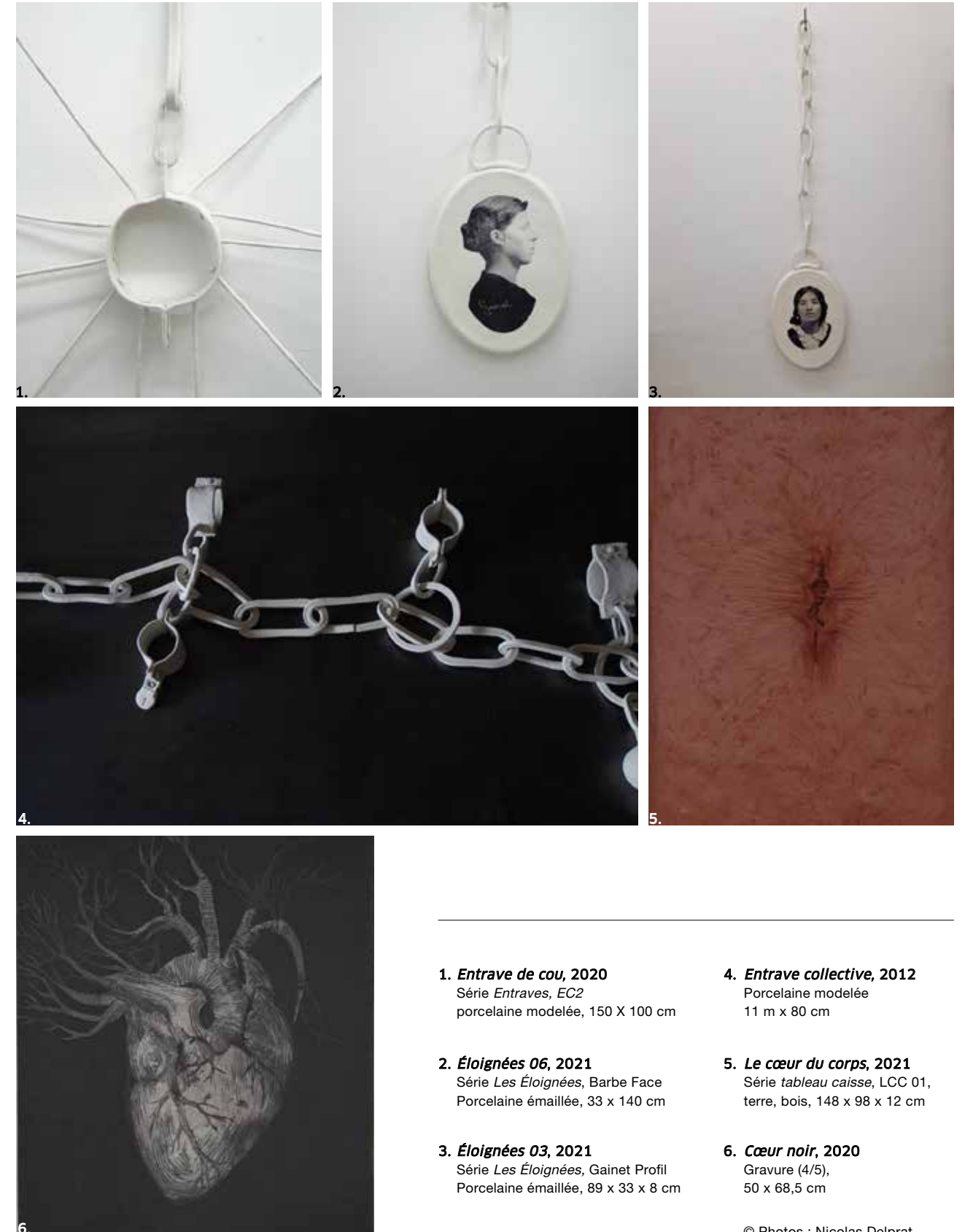
1. Entrave de cou, 2020 Série Entraves, EC2 porcelaine modelée, 150 X 100 cm