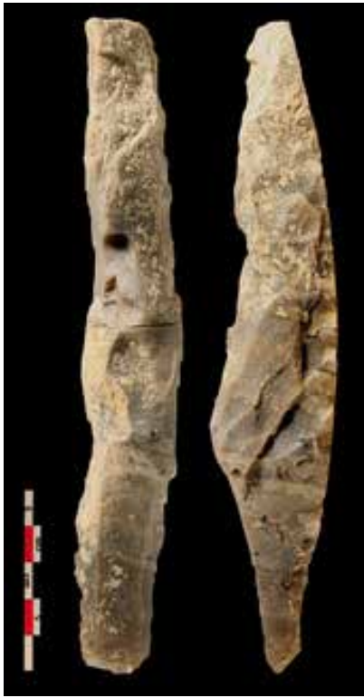
Outil prismatique découvert à Paris sur le site mésolithique de Farman © Inrap /S. Griselin.

La fonction des outils prismatiques est longtemps restée énigmatique même si leur emploi comme pics ou planes — couteaux à deux manches composés d'une lame munie de deux poignées à chaque extrémité, qui sert à enlever l'écorce ou à dégrossir et creuser des formes courbes, galbées, voire droites, et que l'on manie en le tirant vers soi —, a souvent été suggéré.