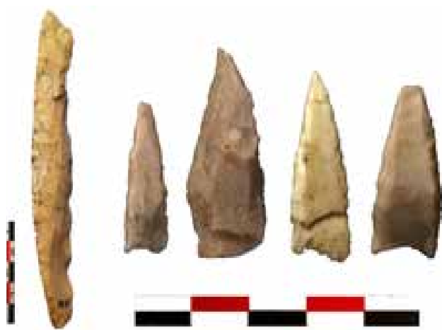
Outils mésolithiques. De gauche à droite : pic montmorencien provenant de Taverny et pointes de Méry-sur-Oise, Baillet-en-France, Villiers-Adam, L'Isle-Adam

Il s'agit de pièces de grande taille, de forme allongée et de section prismatique, ce qui leur vaut d'être appelés outils « prismatiques ».