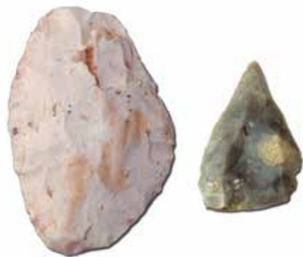
Villiers-Adam, Le Petit-Saule : raclor et pointe Levallois.

D'autres chantiers d'archéologie préventive ont mis en évidence des sites occupés par des néandertaliens, à Louvres-en-Parisis (2014), Persan et Puiseux-en-France (2016).