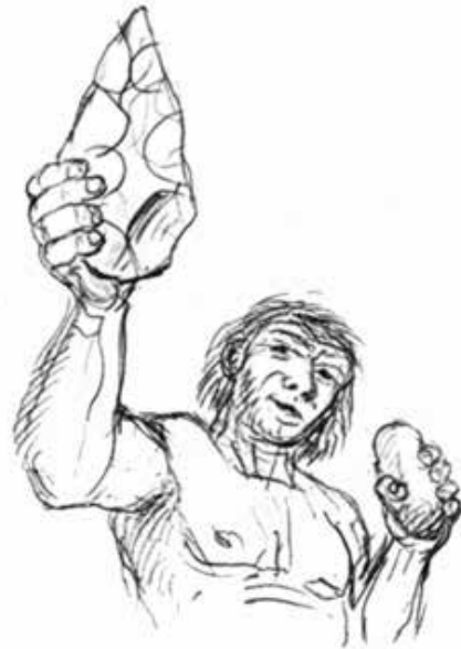
Homme du Paléolithique inférieur brandissant un biface (main droite) et tenant un percuteur (main gauche).

Les sociétés paléolithiques du Val-d'Oise ont laissé peu de traces. Des pierres taillées ont été ramassées en surface dans quelque 150 lieux mais un seul site a été fouillé. Cette rareté s'explique par la faible densité des populations préhistoriques et par la fragilité de leurs campements saisonniers. Elle tient sans doute aussi à une forte érosion dans les vallées ou, à l'inverse, sur les plateaux, au recouvrement des vestiges par les loess qu'ont apportés les vents pendant les glaciations.