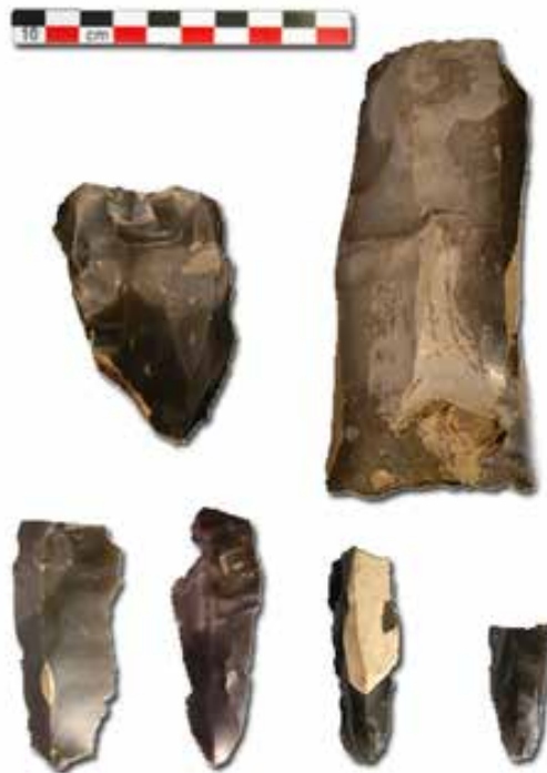
L'Isle-Adam : 2 nucleus et 4 fragments de lames.

Les cultures du Paléolithique supérieur sont très mal connues dans le Val-d'Oise. Là encore, la plupart des témoins proviennent de prospections de surface ou de la fouille de sites plus récents (ville antique et château de Beaumont-sur-Oise, temple gallo-romain de Genainville), et aucun ne correspond à un niveau archéologique en place.