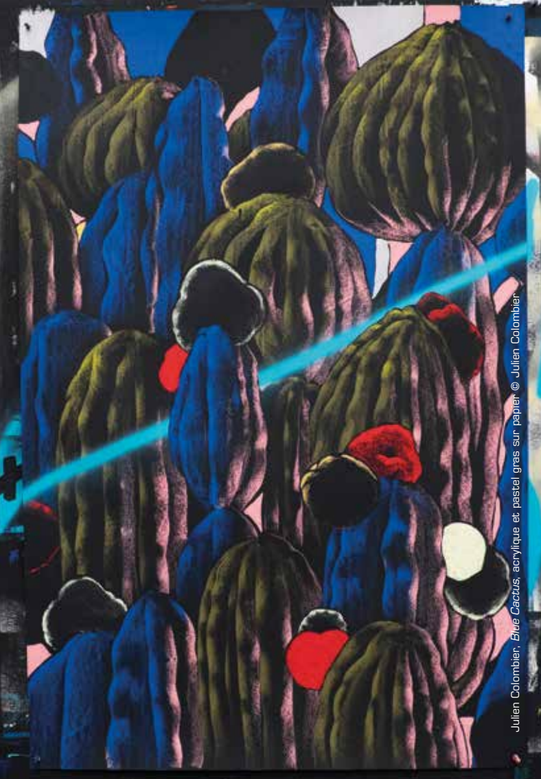
Julien Colombier, Blue Cactus , acrylique et pastel gras sur papier