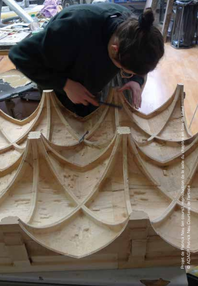
Projet de Patrick Neu (en cours) - reproduction de la salle du chepitre en bois de tilleul © ADAGP Patrick Neu, Courtesy de l'artiste