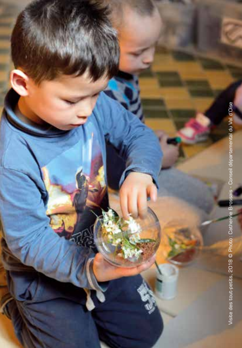
Visite des tout-petits, 2018