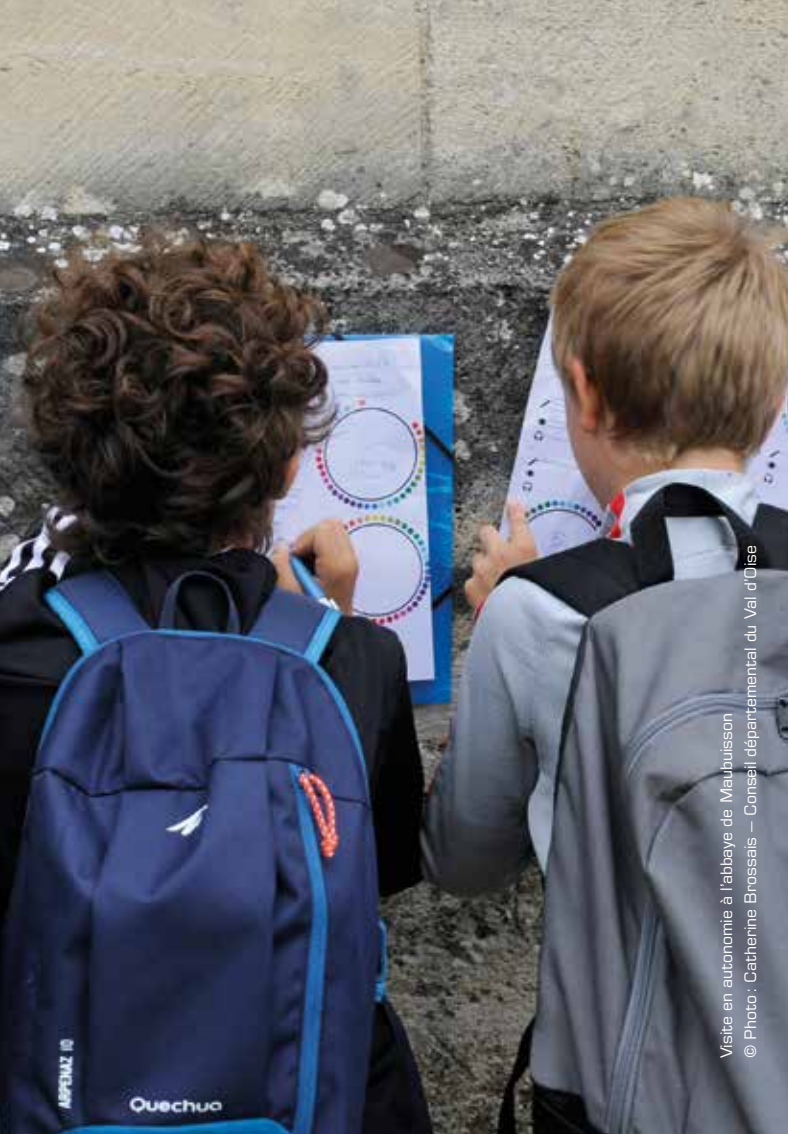
Visite en autonomie à l'abbaye de Maubuisson