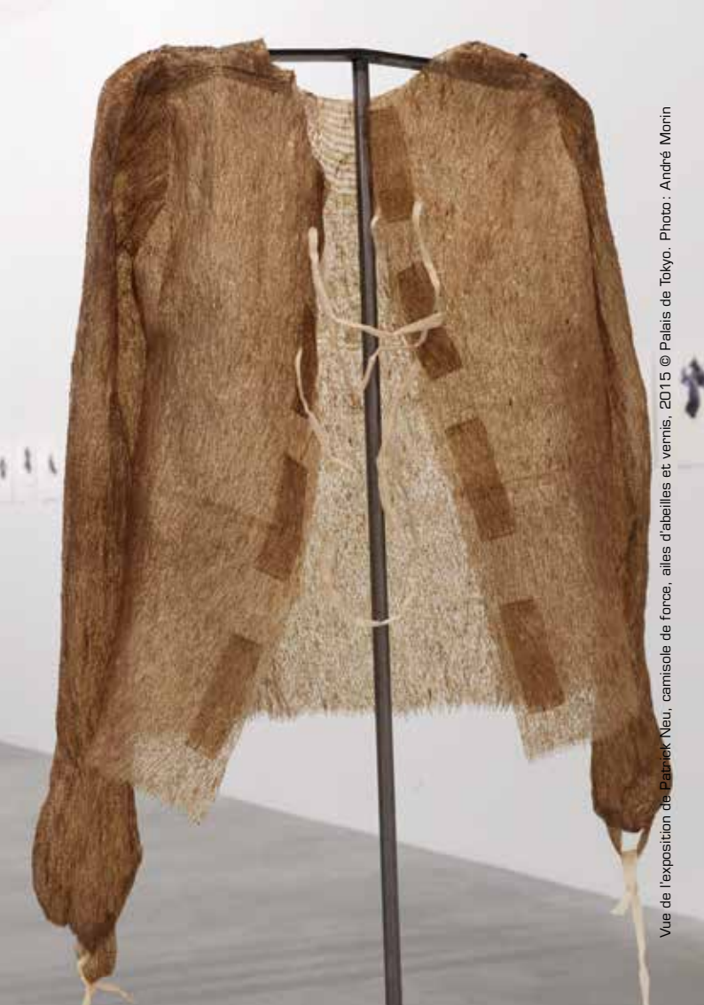
Vue de l'exposition de Patrick Neu, chemise de force, ailes d'abeilles et vernis. 2015