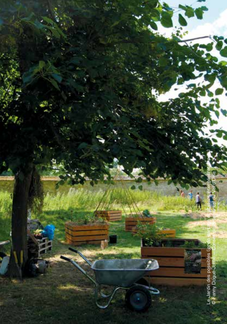
Le Jardin des possibles (un jardin partagé en ateliers intergénérationnels)