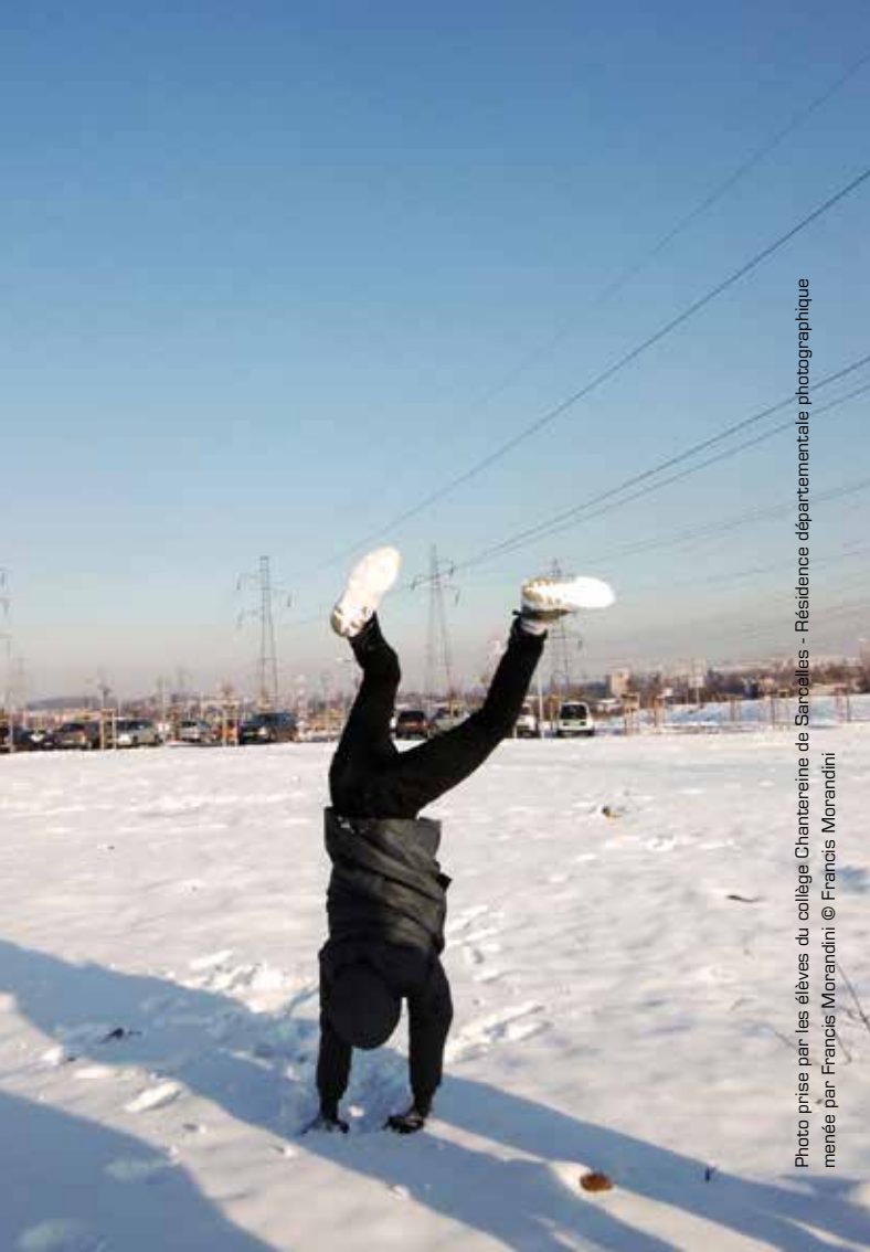
Photo prise par les élèves du collège Chanteraine de Sarcéelles - Résidence départementale photographique menée par Francis Morandini © Francis Morandini

Toutes nos activités sont disponibles sur réservation. N'hésitez pas à contacter notre équipe au 01 34 64 36 10 ou abbaye.maubuisson@valdoise.fr