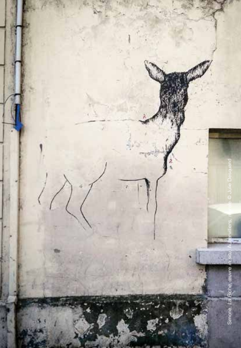
Simone, La Biche, œuvre in situ, Aubervilliers, musée

Contact : Peggy Pecquenard / 01 34 64 36 10 / peggy.pecquenard@valdoise.fr