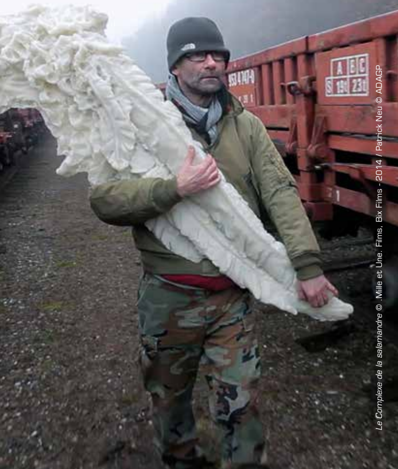
Le Complexe de la salamandre © .Mille et Une. Films, Bix Films - 2014 / Patrick Neu © ADAGP