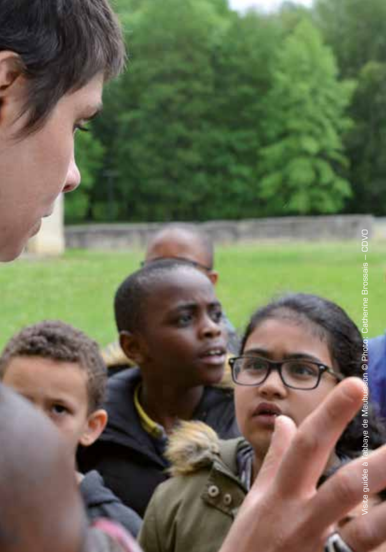
Visite guidée à l'abbaye de Maubuisson

L'abbaye de Maubuisson propose des actions de sensibilisation autour des axes qui structurent son identité : art contemporain, patrimoine et environnement naturel. Ces actions prennent la forme de visites thématiques, d'activités de plein air et d'ateliers de pratiques artistiques et s'adaptent à tous les publics.