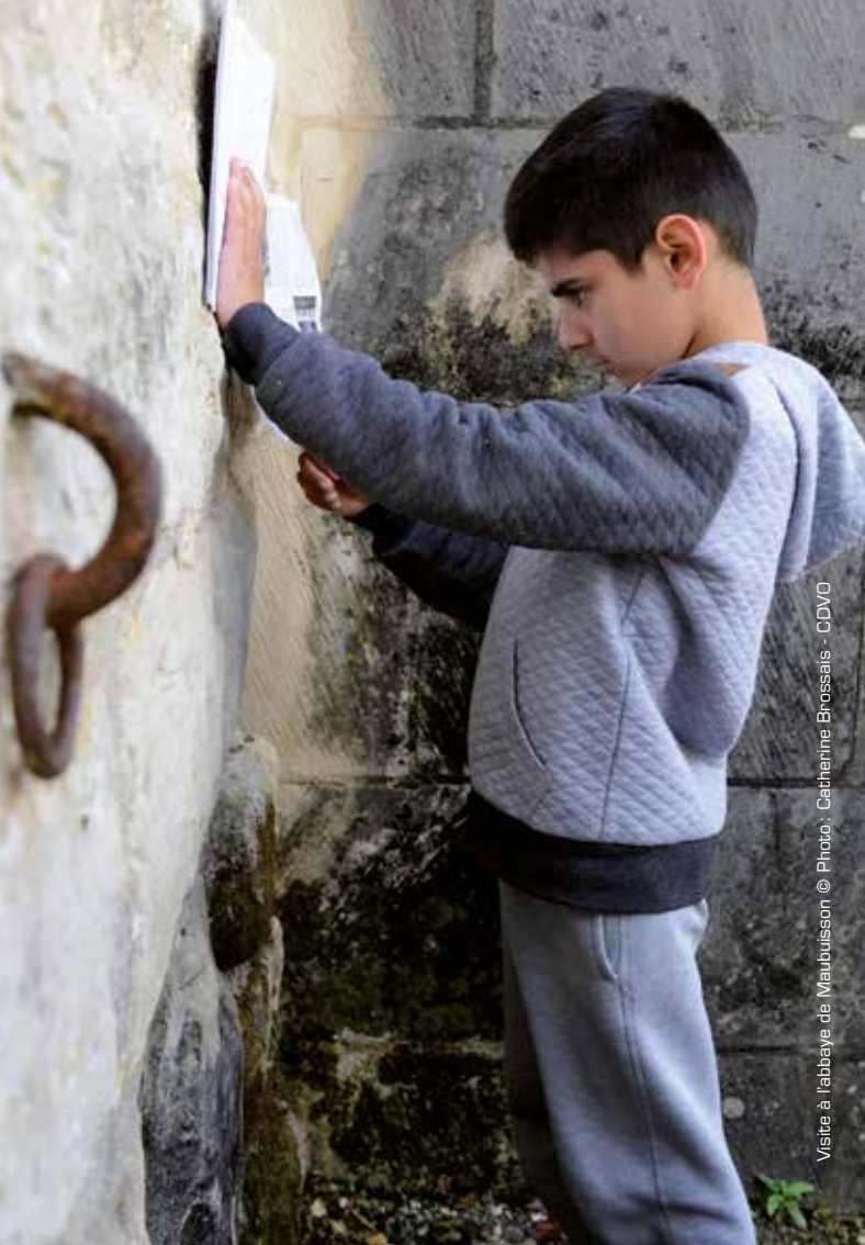
Visite à l'abbaye de Maubuisson