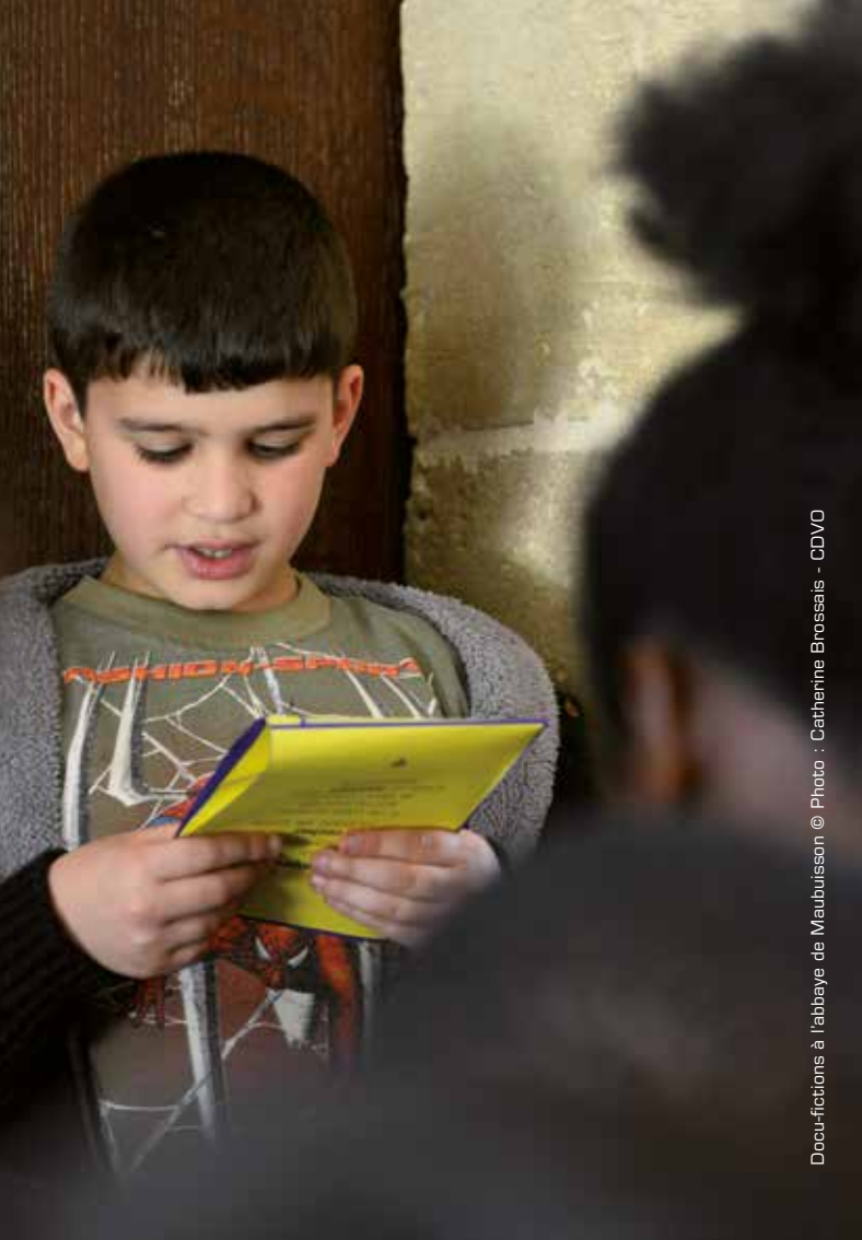
Docu-fictions à l'abbaye de Maubuisson