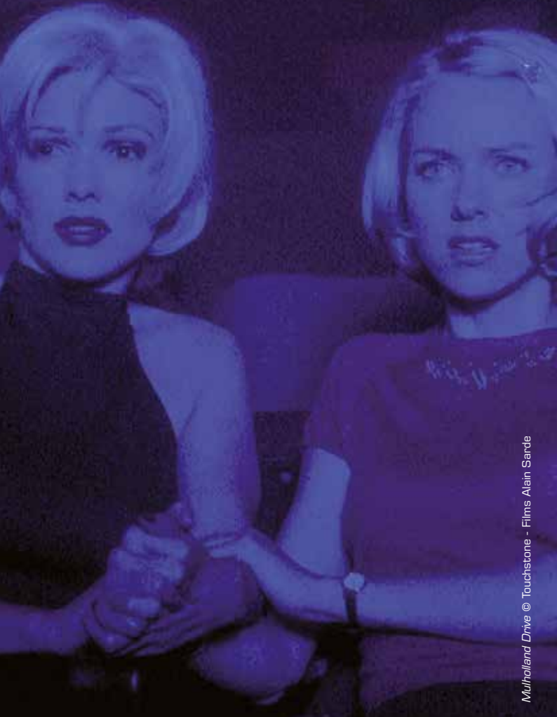
Mulholland Drive