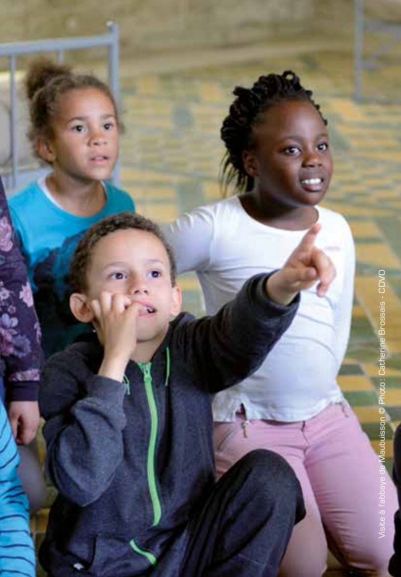
Visite à l'abbaye de Maubuisson